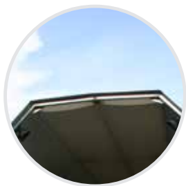
Eine Baumwoll-Innenplane schützt die Ladung gegen Kondenswasser

Die eigene Achsschwinge konstruktion profitiert von den jahrzehntelangen Erfahrungen aus unterschiedlichsten Anwendungsbereichen – und dies weltweit.