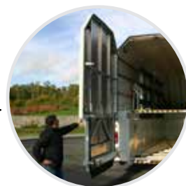
Hecktür aus Aluminium – geringes Gewicht, bester Schutz